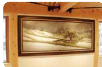
塩谷亮「晩春近江」 Ryo Shiotani「Banshunoumi」