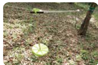
子ども用スライダー Children's Slider