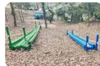
すべり台 Bamboo Playground Equipment