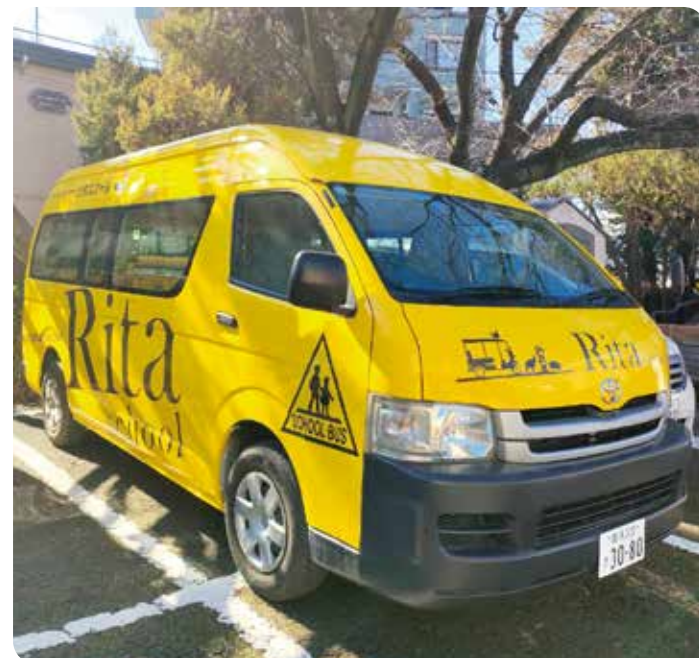
園バス Preschool bus