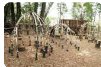
竹の遊具 Bamboo Playground Equipment