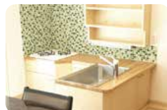
子どもキッチン Children's Kitchen