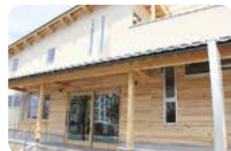
園舎入口 School entrance