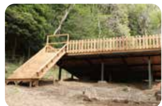
ウッドデッキ Wood deck