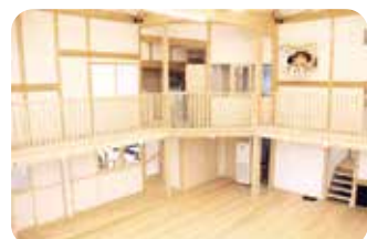
ホール 2 階から View from the second floor of the hall