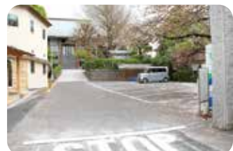
園舎と駐車場と境内 Parking lot and grounds