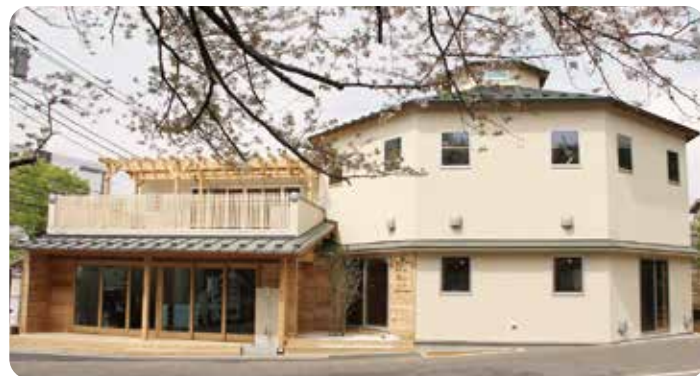
園舎外観 Appearance of our preschool